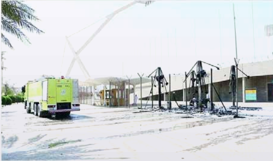
الدفاع المدني أحمد الحريق