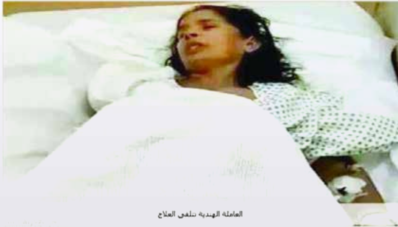
العاملة الهندية تلقي العلاج

مؤكدة أن محاولتها للهروب عبر النافذة تسبب في بتر يدها شرطة الرياض تنفي تعرض العاملة الهندية للاعتداء