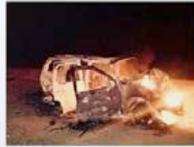
حادث التصادم الذي وقع غرب عفيف.