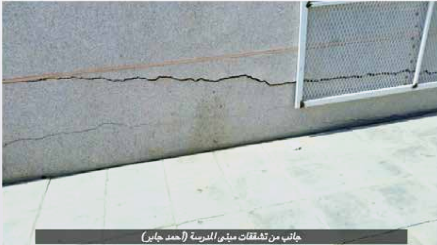
جانب من تشققات مبنى المدرسة (أحمد جابر)