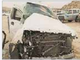
حطام سيارة السيني في أحد ريفية.