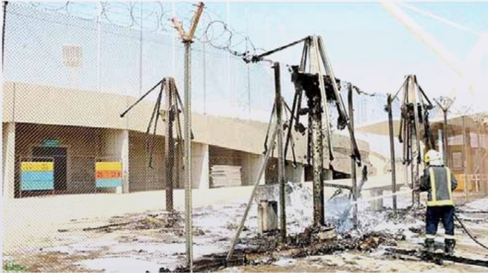
أحمد اللحباني (مكة المكرمة)