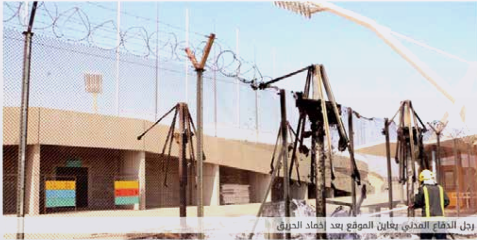
رجل الدفاع المدني يعاين الموقع بعد إخماد الحريق