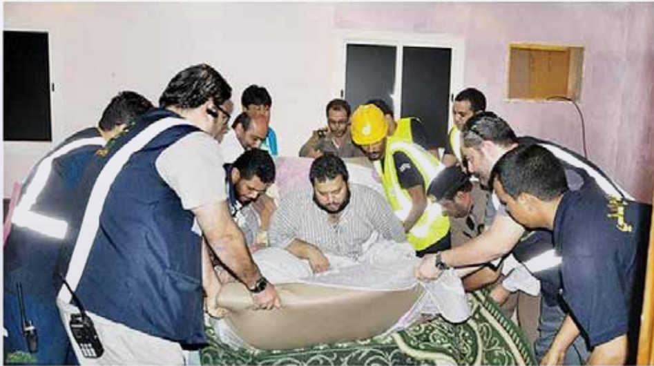
خالد الحميدي (مكة المكرمة)

وجه صاحب السمو الملكي الأمير محمد بن نايف بن عبدالعزيز ولي العهد نائب رئيس مجلس الوزراء وزير الداخلية، بعلاج مواطن مصاب بمرض داء الفيل خارج المملكة.