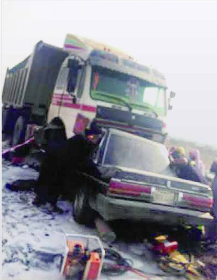
العادت المأساوية وقع بسبب التجاوز الحاطن