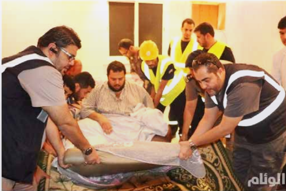
مكة المكرمة -الوثام - بدر الهويل وحجب العصيمي:

قامت وحدات الإنقاذ بالإدارة العامة للدفاع المدني بالعاصمة المقدسة، صباح هذا اليوم الخميس، بنقل مواطن مصاب بسمنة مفرطة وزن حوالي 250 كيلو وبأمراض مزمنة إلى مستشفى النور التخصصي، تمهيداً لنقله إلى أحد المستشفيات المتخصصة في جمهورية ألمانيا الاتحادية بعد أن تكفل سمو ولي العهد الأمير محمد بن نايف بعلاجه.