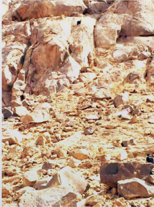
العززة قبل إنقاذها

تمكنت فرق الدفاع المدني في منطقة حائل، صباح أمس، من إنقاذ «عززة» علق في أحد الجبال جنوب حائل. واستخدم رجال الدفاع المدني في عملية الإنقاذ السلام والحبال والأجهزة الحديثة. وفي التفاصيل، تلقى مركز الدفاع المدني بلاغاً يفيد بوجود عززة عالقة في أحد الجبال المرتفعة، ولم يستطع صاحبها السيطرة عليها، وعلى الفور باشرت فرق من الدفاع المدني الموقع. واستعانت بمعدات المتطورة، وتمكنت من إنقاذ حياة العززة.