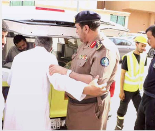
رجال الدفاع المدني خلال عملية نقل المريض