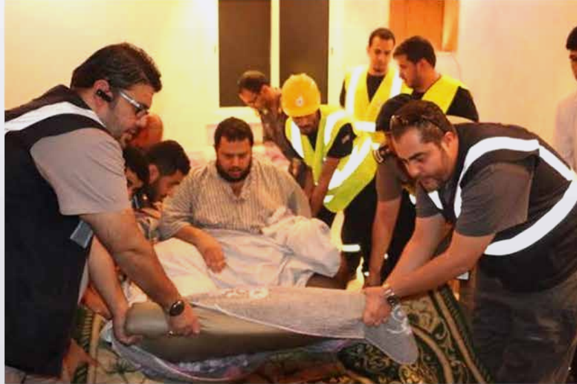
مكة المكرمة-حسين العلي

قامت وحدات الإنقاذ بإدارة العامة للدفاع المدني بالعاصمة المقدسة، الخميس (15 أكتوبر 2015)، بنقل مواطن مصاب بسمنة مفرطة يزن نحو 250 كيلو، ومصاب بأمراض مزمنة إلى مستشفى النور التخصصي، تمهيداً لنقله إلى أحد المستشفيات المتخصصة في ألمانيا بعد أن تكفل ولي العهد الأمير محمد بن نايف بعلاجه.