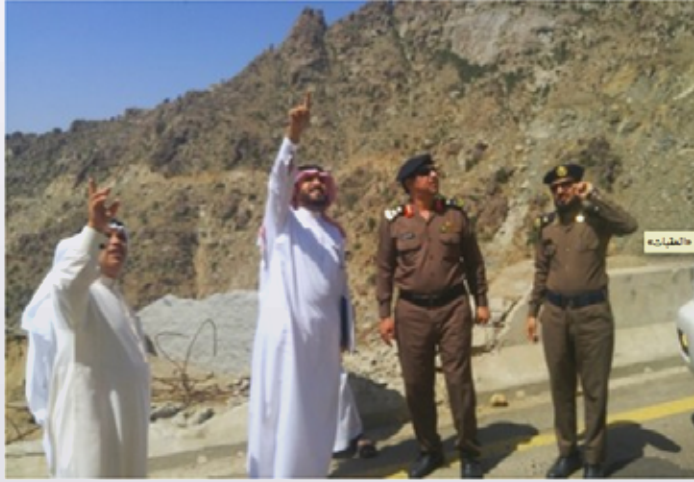
غرفة أمير الباحة يوجه بسرعة معالجة أخطار «العقبات»

وجه صاحب السمو الملكي أمير منطقة الباحة الأمير مشاري بن سعود بن عبدالعزيز بسرعة معالجة كافة الأخطار الناجمة عن «عقبة حزنة» وغيرها من الأخطار بمنطقة الباحة، وأكد وكيل الإمارة للشؤون التنموية الدكتور فيحان بن حمود العتيبي أن سموه يولي هذا الموضوع اهتماما كبيرا، ووجه الجهات