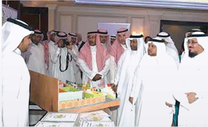
الثلاثي في جولة بالمعرض الصحي المصاحب للبرنامج