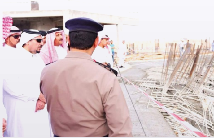
أمير القصيم خلال وقوفه على موقع الحادث

لجنة من 5 جهات تحقق في انهيار مبنى تحت الإنشاء في جامعة القصيم