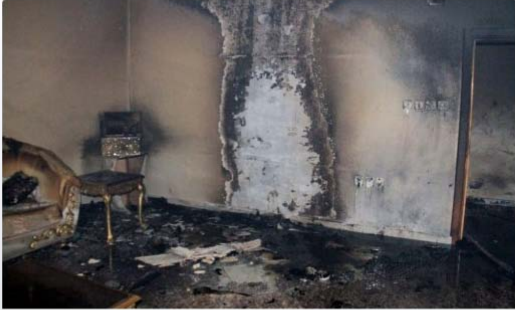
الدفاع المدني بالعاصمة المقدسة يسيطر على حريق بالشرائع ١٤٣٦-٠٧-٠٩ هـ