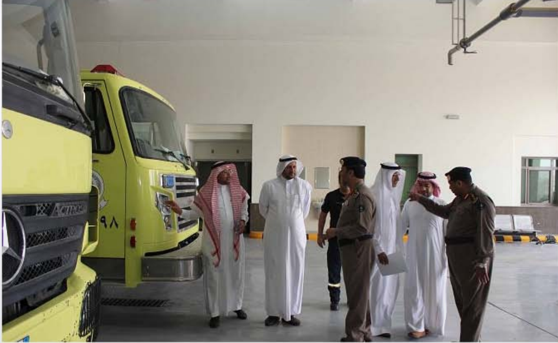
أعضاء المجلس البلدي خلال زيارتهم الدفاع المدني في الأحساء