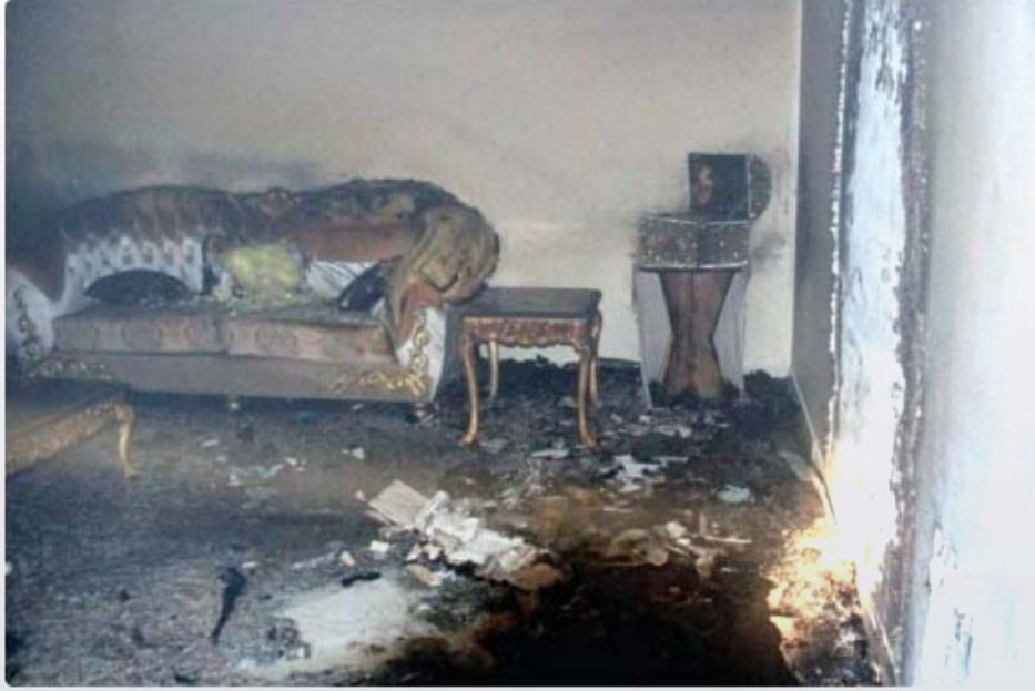
الغرفة بعد احتراقها