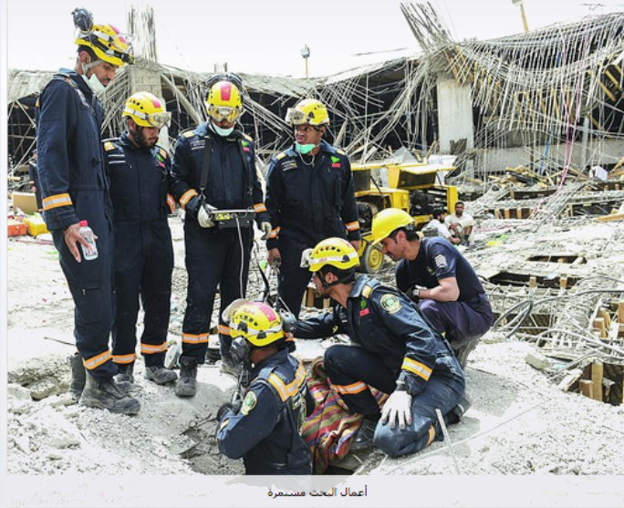
أعمال البحث مستمرة