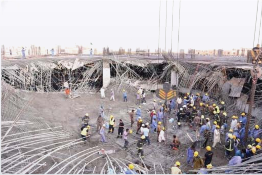
فرق الدفاع المدني والهلال الأحمر في موقع الحادث