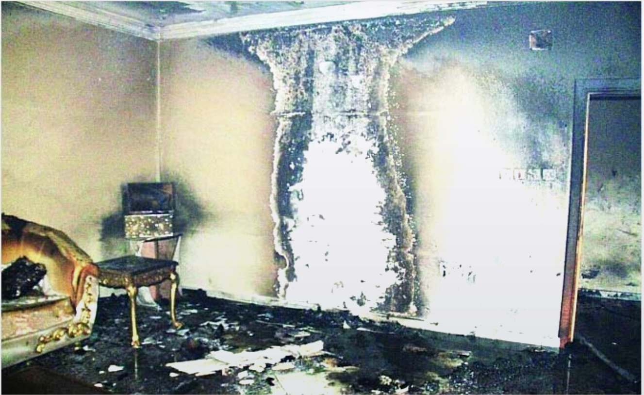
الغرفة المحترقة تحولت إلى رماد