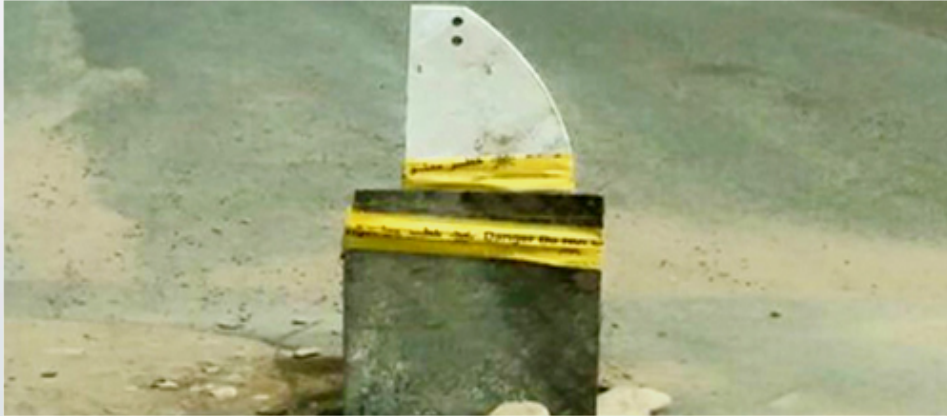
الحفرة بعد معالجتها من جانب الدفاع المدني