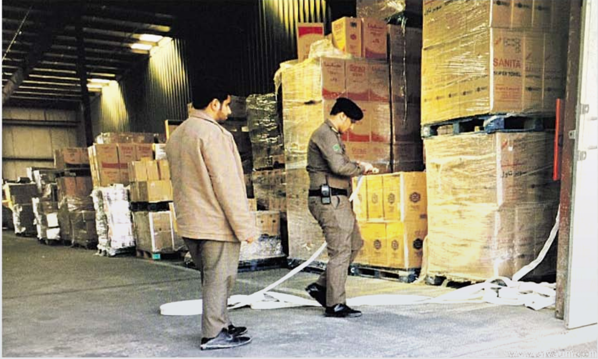
الحملة تعابن أحد المستودعات