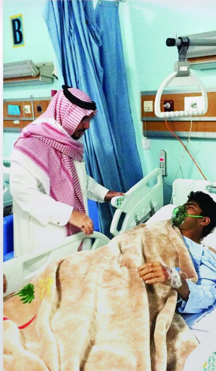
الأمير فيصل بن مشعل يطمئن على سلامة المصابين

أمير القصيم يزور مصابي «الانهيار».. ويلوح بعقاب رادع للمتساهلين