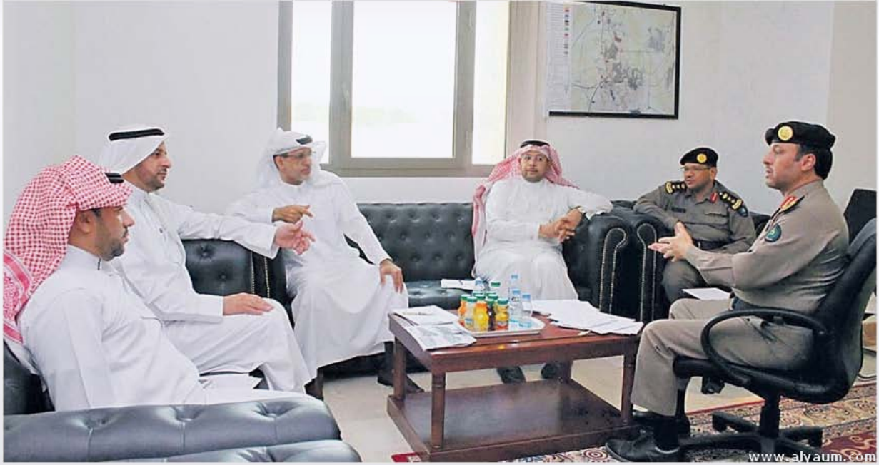
«البلدي» و«المدني» خلال اجتماعهما أمس