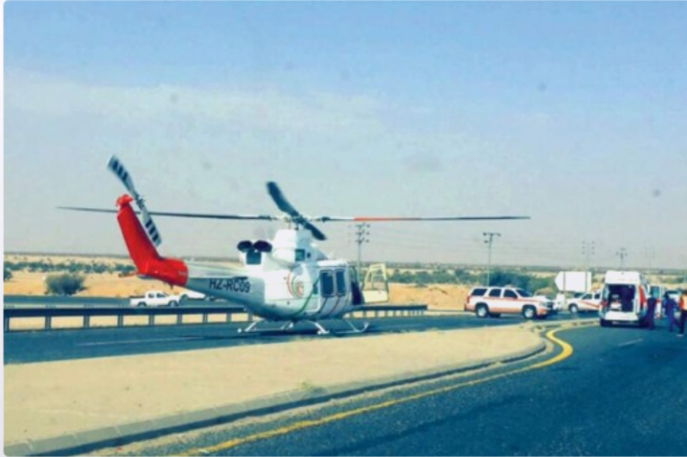
الإسعاف الطائر باشر نقل الحالات