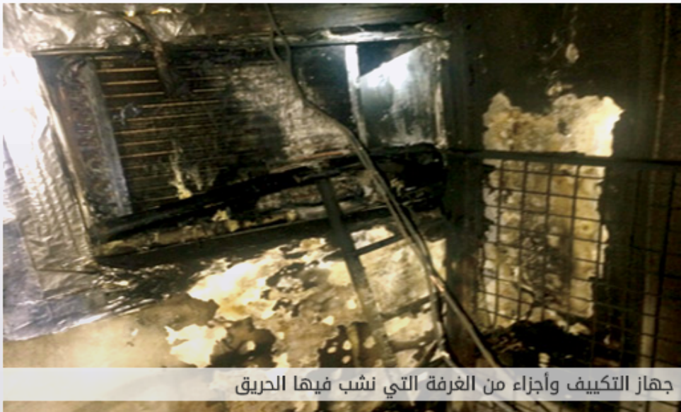
جهاز التكييف وأجزاء من الغرفة التي نشب فيها الحريق