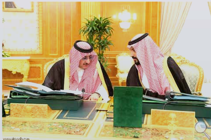
الأمير محمد بن نايف وحديث مع الأمير محمد بن سلمان