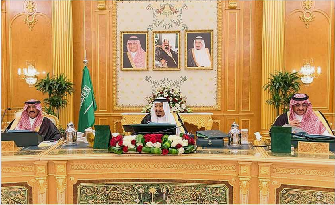
الملك سلمان وولي العهد و د. عبدالرحمن السدحان