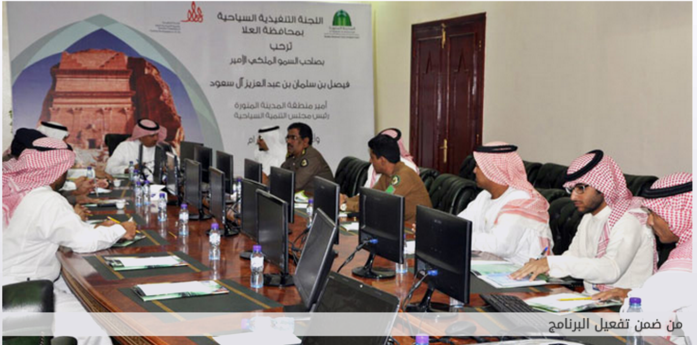
من ضمن تفعيل البرنامج