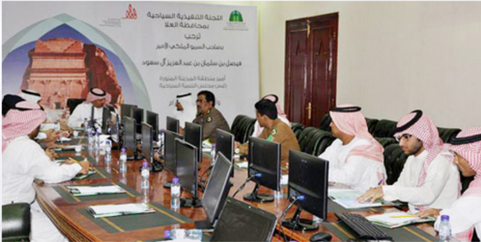
الثلاثاء 13 أكتوبر 2015