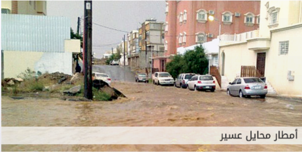
أمطار محايل عسير