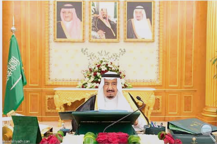
خادم الحرمين مترئساً لمجلس الوزراء

واطلع مجلس الوزراء على التقرير السنوي لوزارة الشؤون الإسلامية والأوقاف والدعوة والإرشاد للعام المالي (1434 / 1435هـ)، وعلى التقرير السنوي (الخامس) لقياس تحول الجهات الحكومية إلى التعاملات الإلكترونية الحكومية، وقد أحاط المجلس علماً بما جاء فيهما واتخذ حيالهما ما يلزم من توجيهات.