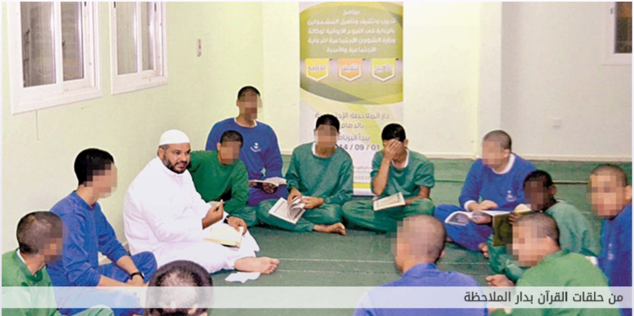
من حلقات القرآن بدار الملاحظة