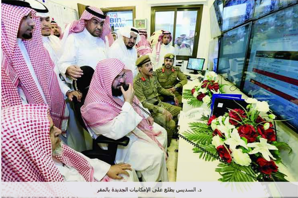
د. السديس يطلع على الإمكانيات الجديدة بالمقر