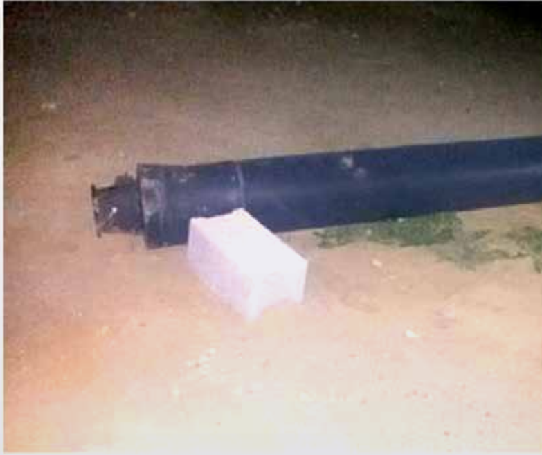
بقايا أحد المقذوفات التي أطلقها المتمردون