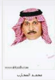
www.albahrain.com محمد المحارب