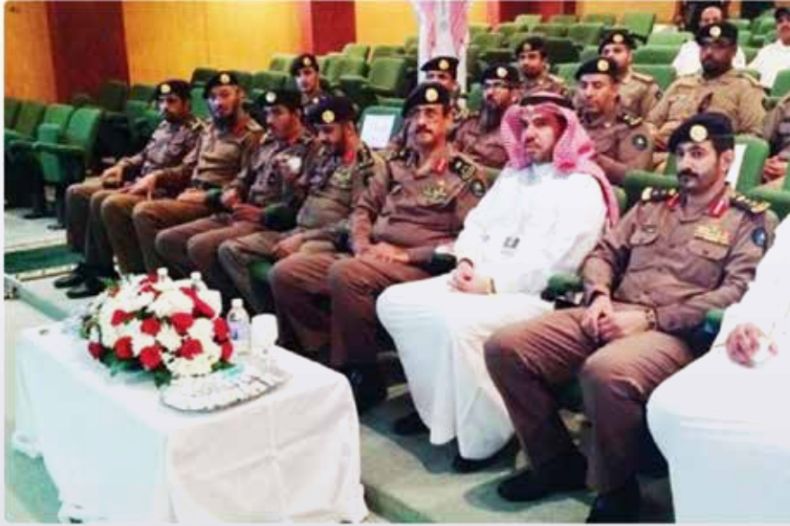
حفل تكريم رجال الدفاع المدني