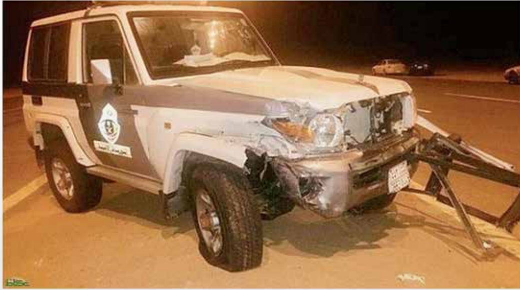
عكاظ (المكاتب الداخلية)