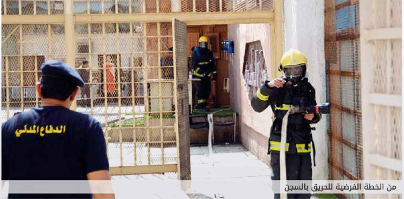
من الخطة الفرضية للحريق بالسجن