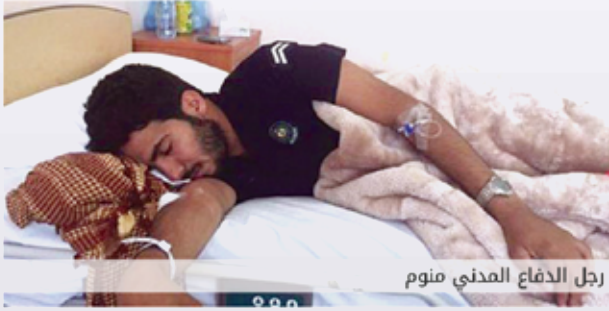
رجل الدفاع المدني منوم