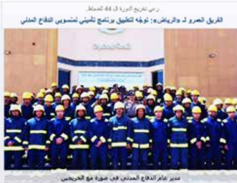
رئيس تفریح التورہ فی 44 التمداد الفريق الصرو ك والفرياض: توجّه لتطبيق برنامج تلمیني لمشغوب الدفاع المدني