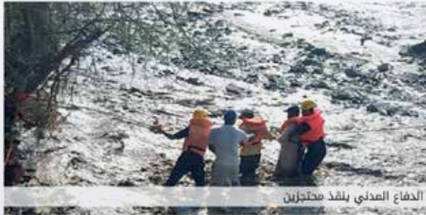
الدفاع المدني ينقذ محتجزين