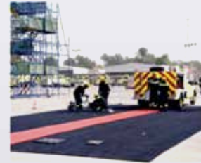
أحد العروض التي قدمها الخريجون خلال الحفل