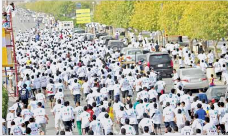
المتسابقون في لحظة سباق