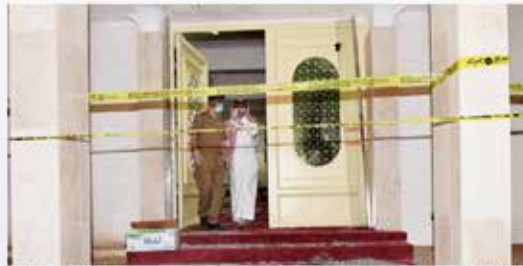
الجمعة 17 أكتوبر 2015

نجران: مديرو الجهات الحكومية والمشايخ والمواطنون يستنكرون تفجير نجران