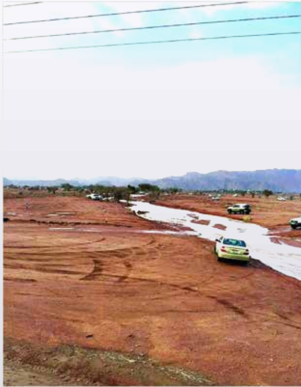
جريان أحد الأودية إثر الأمطار الغزيرة على حائل

«مدني حائل» يحترق من الاكتراب من بطون الأودية.. ويبشر إقناذ المحتجزين