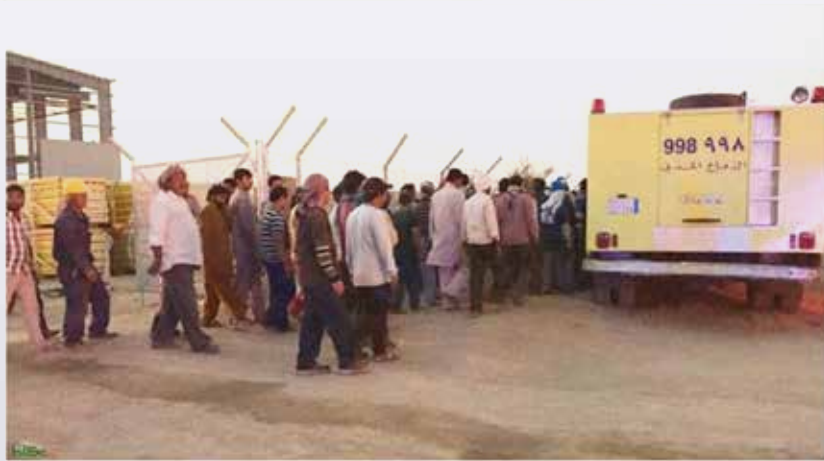
بدر القمامي (الطائف)