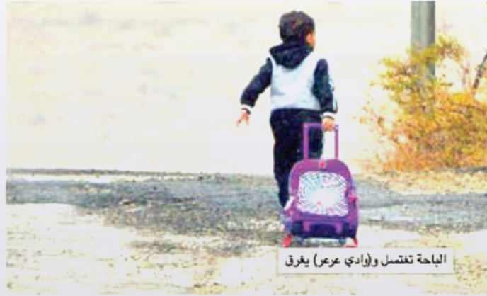
الباحة تغتسل و(وادي عرعر) يفرق