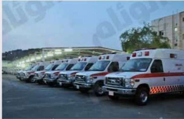
التائف