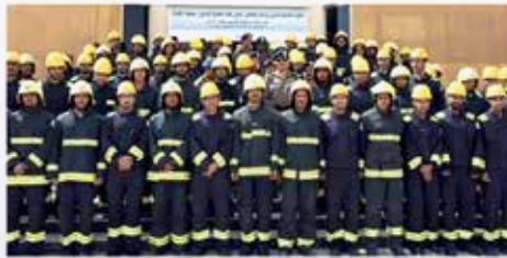
الجمعة 30 أكتوبر 2015