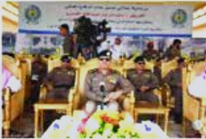
الفريق الصرو برعش تخريج التورہ التامیلة لـ 44

ومن جانب آخر، ذكر مدير معهد الدفاع المدني تطهير و عياده بن عبد الرحمن التمرسي في كلمته خلال الحفل ان المعهد بلغ 26 برنامجاً تدريسياً منذ بداية العام 1436 هـ بمختلف المستويات والشخصيات التي بلغ ضمن مهام اصبل الدفاع المدني، شارك فيها 666 متدرباً من الضباط والفرأ، منهم 72 من مشغوب اجهزة الدفاع المدني والتسبب العنصرية دول مجلس التعاون الخليجي، ومعهم من الوزارات والافجهزة الحكومية.