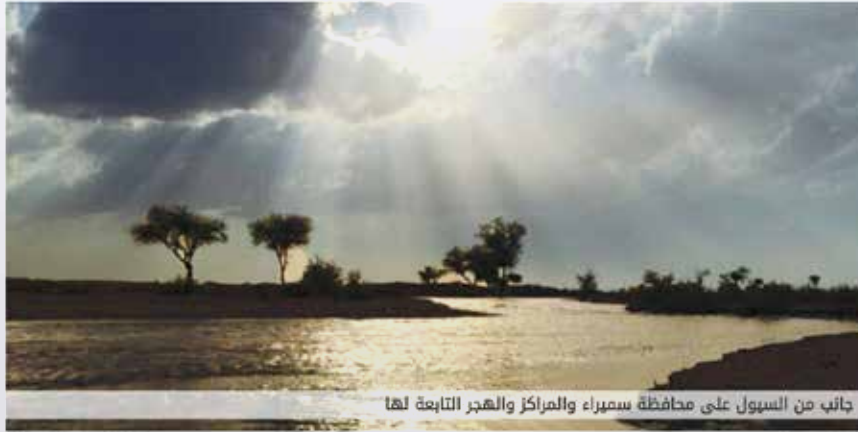
جانب من السيول على محافظة سميراء والمراكز والهجر التابعة لها