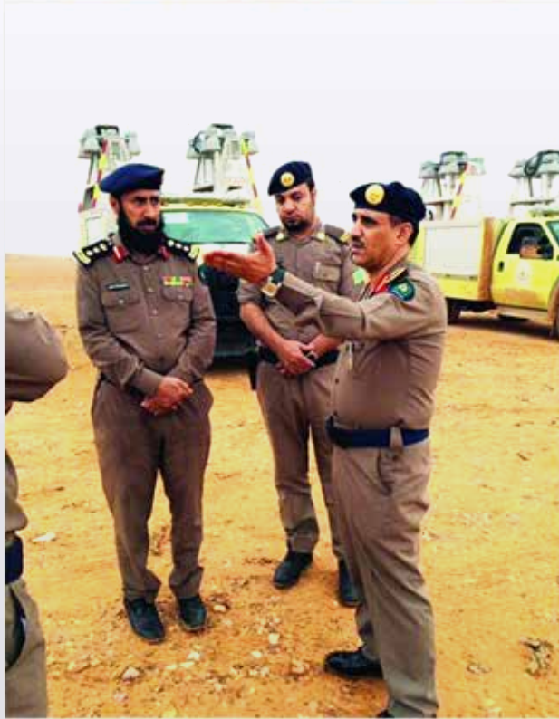
عمير الدفاع المدني في وادي طريف