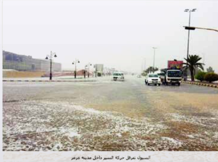
السيون تعرقل حركة السير داخل مدينة عرعر