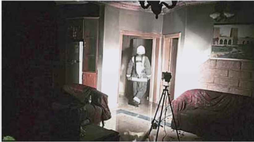
عوض الشليلي (المجمعة)