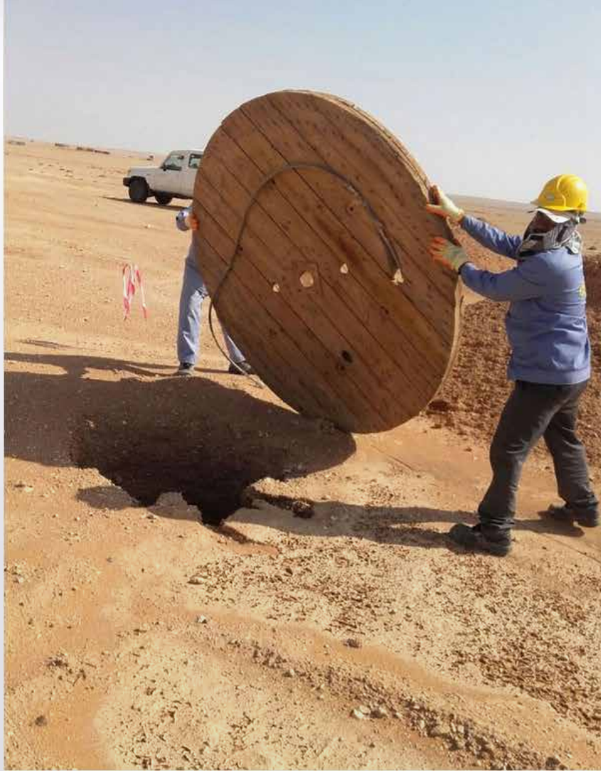
عمال الشركة يباشرون أعمال المعطية