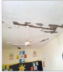
تصدعات واضحة في سقف الفصول.