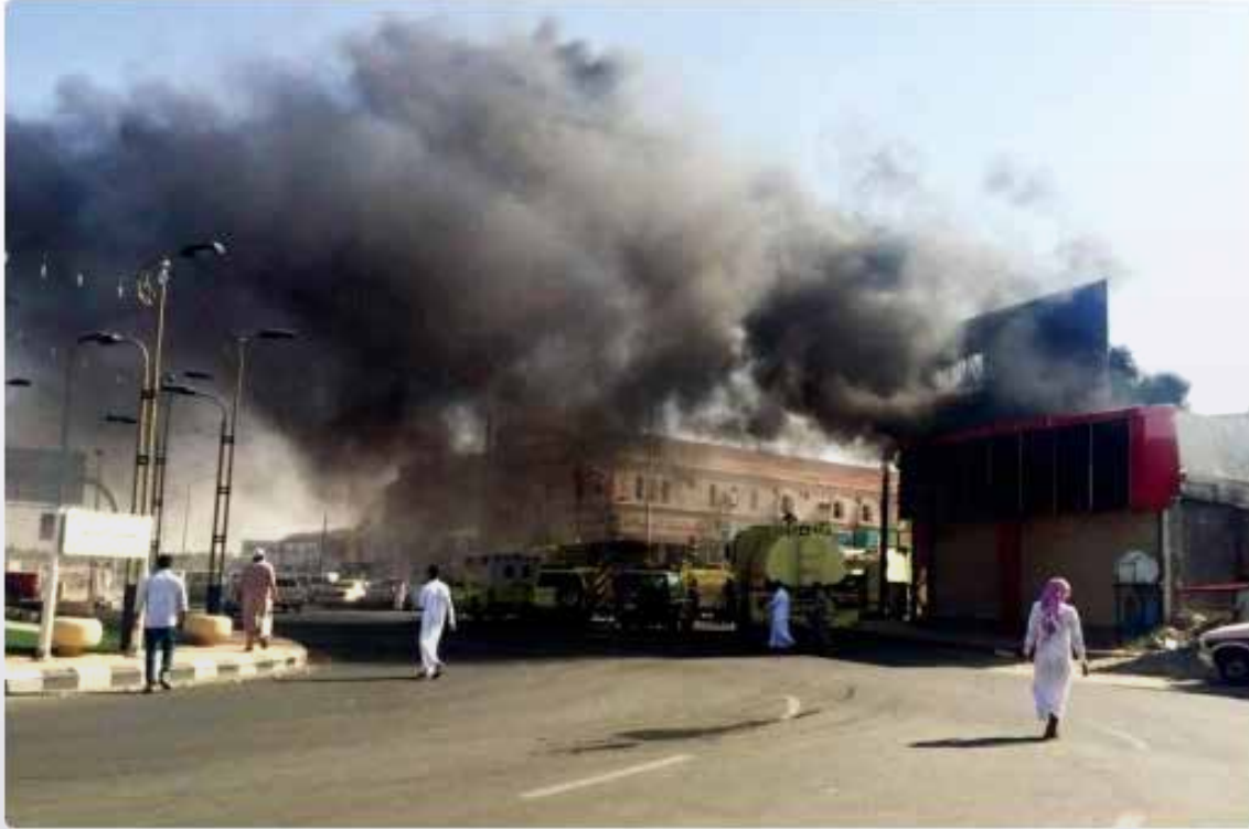
التهمت النيران محل الملابس