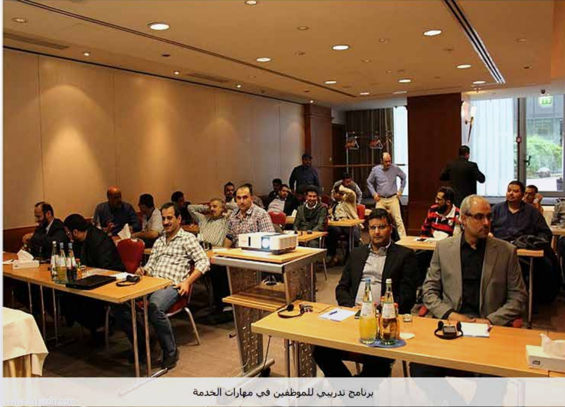
برنامج تدريبي للموظفين في مهارات الخدمة