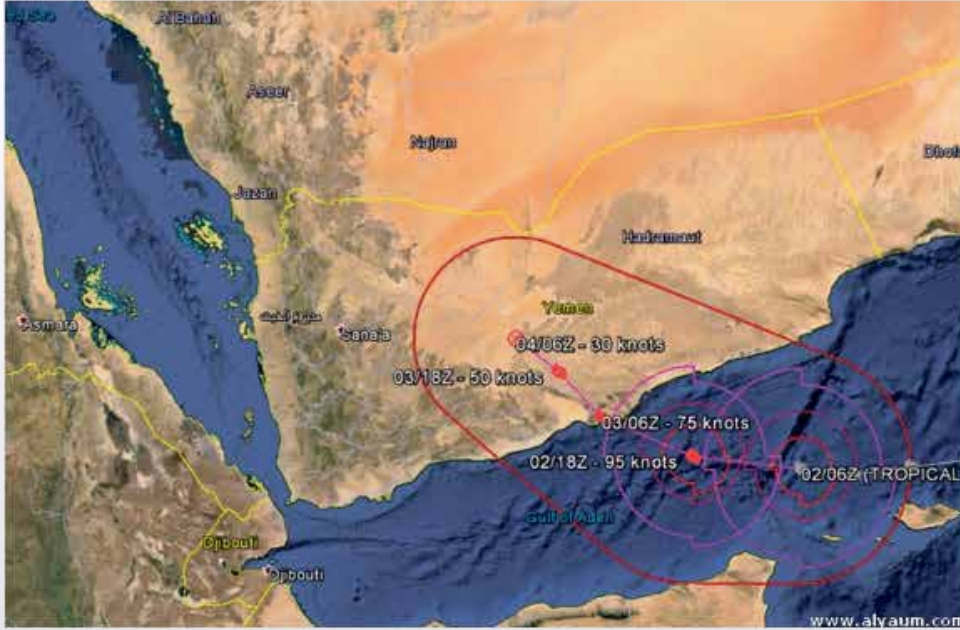
الإعصار يخف تأثيره خلال الساعات القادمة

عبد العزيز العري، عبداللطيف المحيسن - جدة، الأحساء