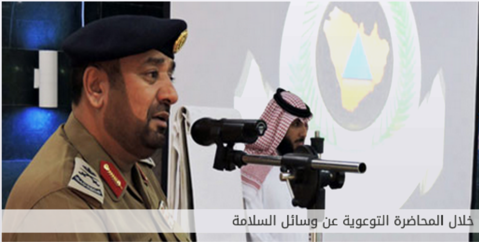
خلال المحاضرة التوعوية عن وسائل السلامة