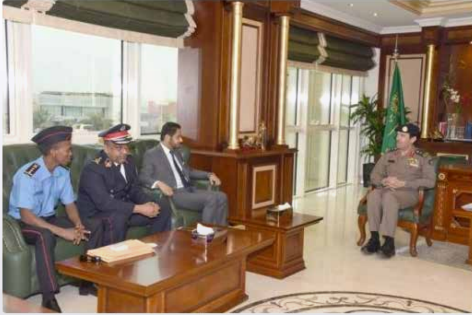
الفريق العمرو مستقبلاً مدير عام الدفاع المدني الجبوتي (الشرق)