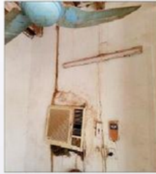
وضع غريب لتوصيل الإضاءة والكيف.