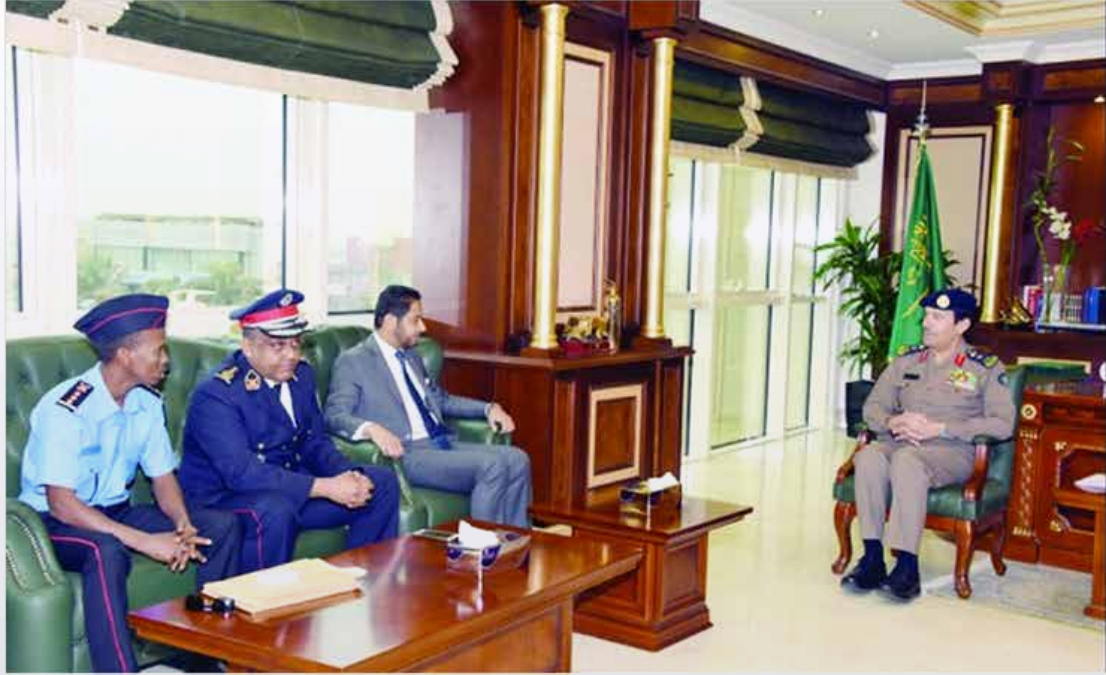
الفريق العمرو يبحث مع مدير الدفاع المدني بجيبوتي مجالات التدريب