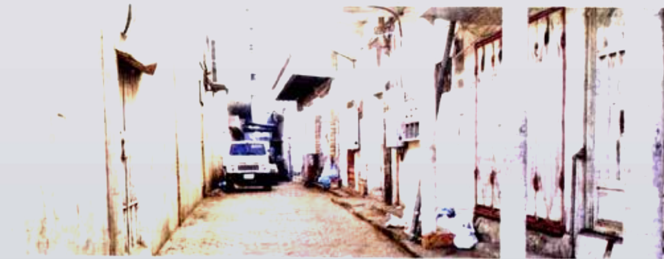
أحد الشوارع الداخلية وسط خميس مشيط