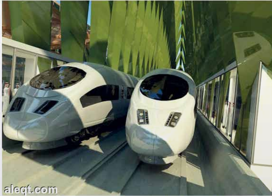
المشروع يضم 35 قطارا في رحلتى الذهاب والإياب بين المحطات.