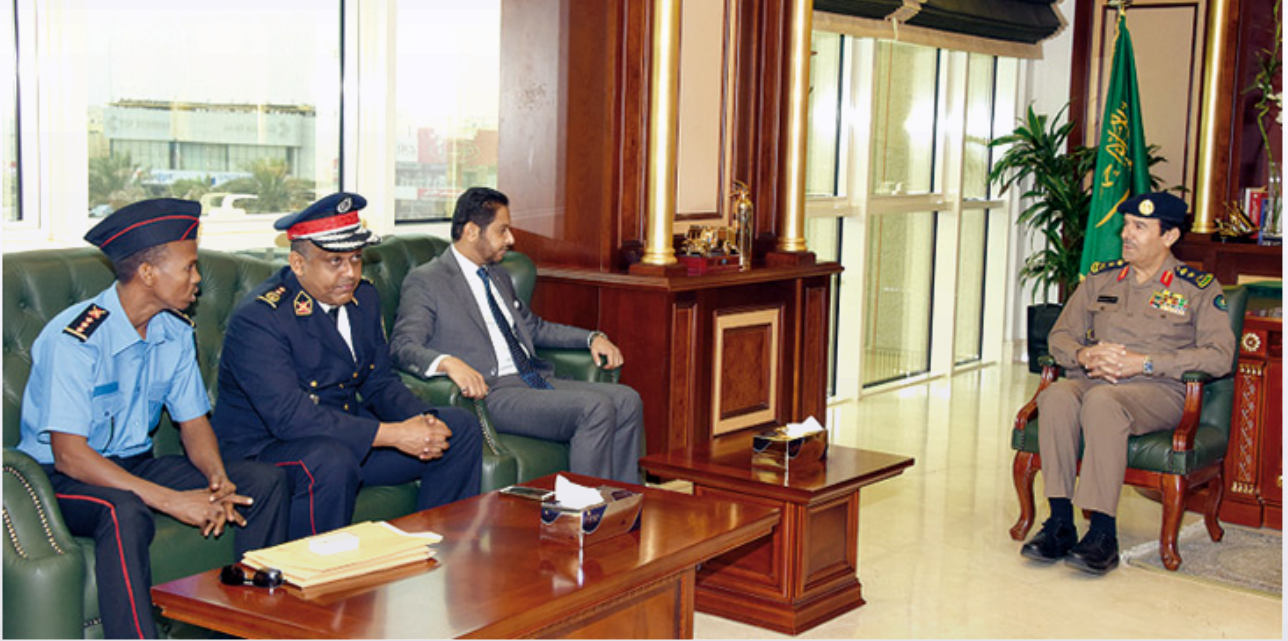
الثلاثاء 03 نوفمبر 2015