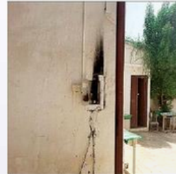
كيل كهربائي مكشوف بالقرب من أيدي الطلبة.