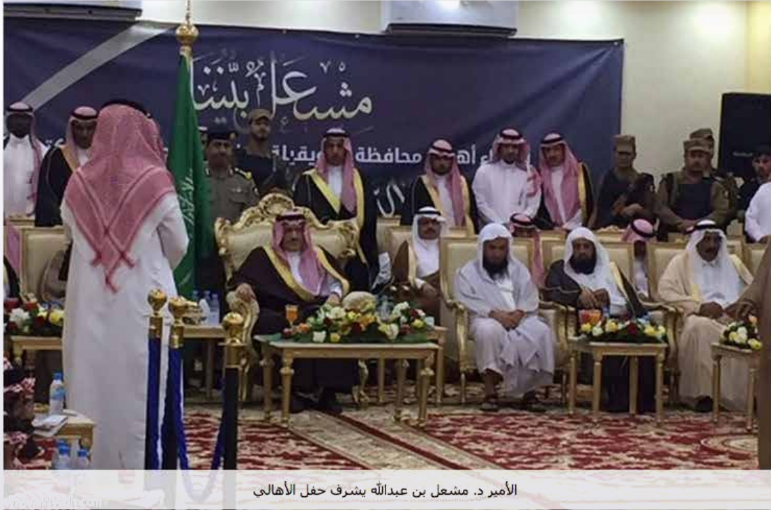
الأمير د. مشعل بن عبدالله يشرف حفل الأهالي