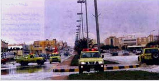
دورية الدفاع المدني تلتقي أحد الطرق في حفر الباطن