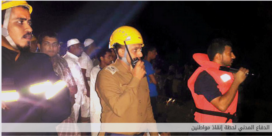
الدفاع المدني لحظة إنقاذ مواطنين