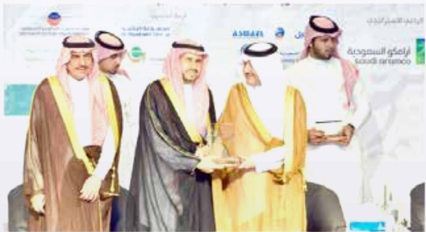
شابت عبد الوهاب

لأمير سعود بن نايف شريم رئيسه السعودية لرعايتها الاجتماعية المبتدئ