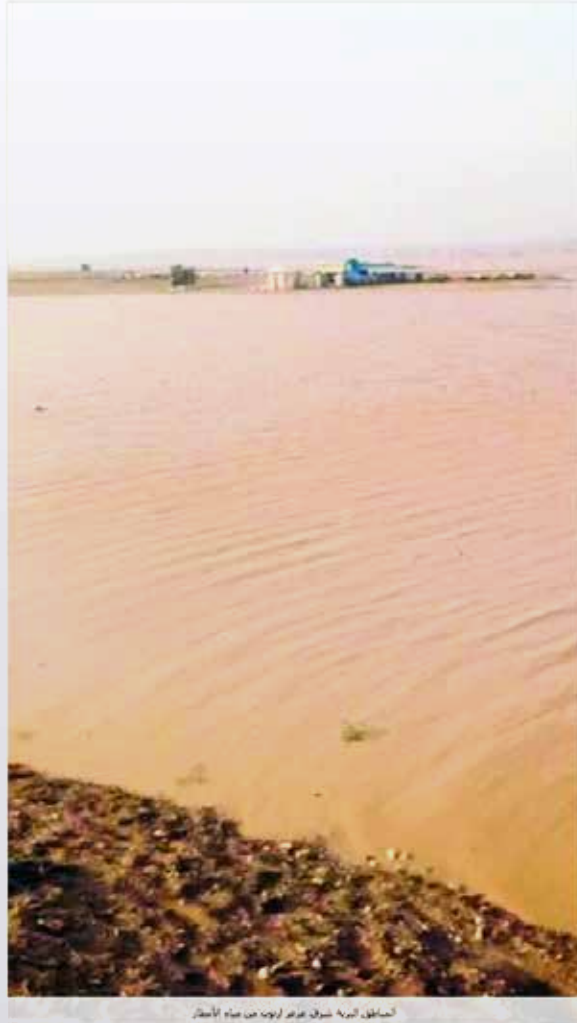
المناطق الريفية شرق عرعر لوجه من مياه الأمطار