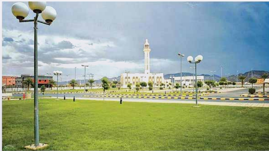
أحمد فراج (نجران)