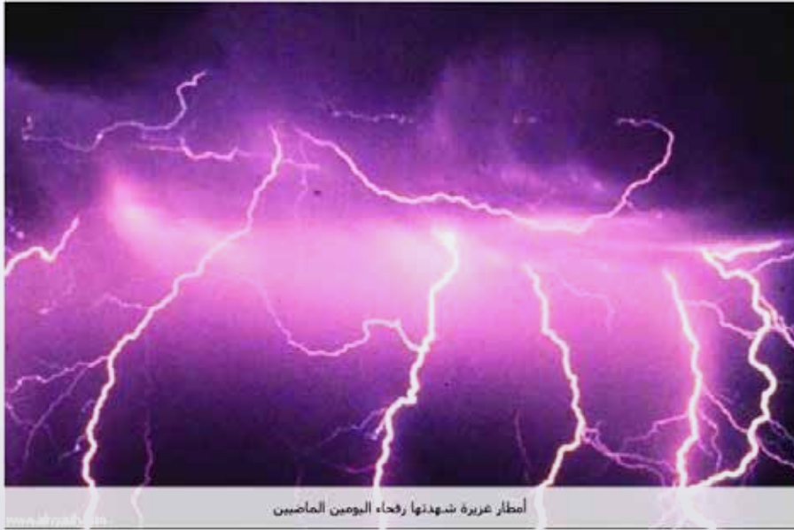
أمطار غزيرة شهدها رفحاء اليومين الماضيين