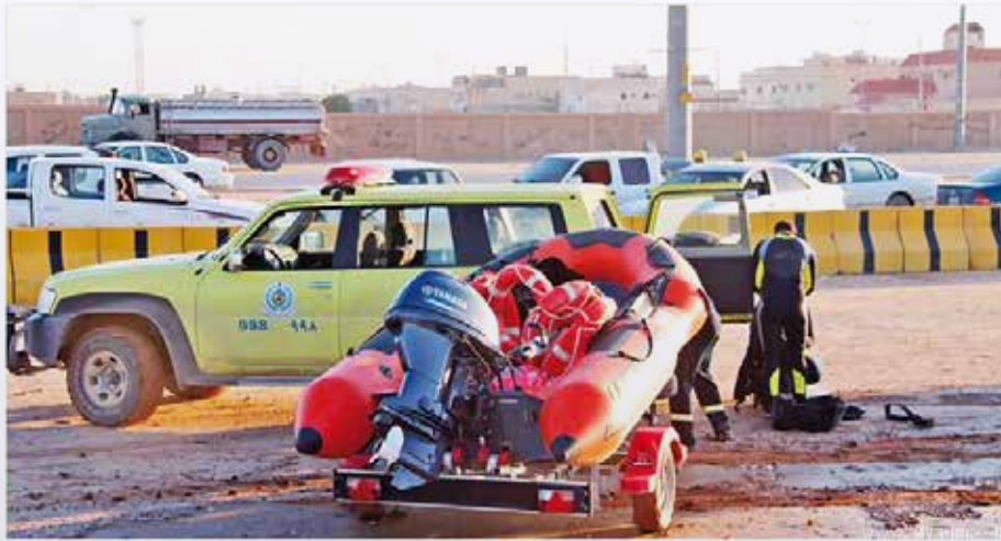
الدفاع المدني حشد البنية لمواجهة الطوارئ

«مدني الشرقية»: 550 بلاغاً وإنقاذ 60 محتجزاً نتيجة الأمطار بحفر الباطن