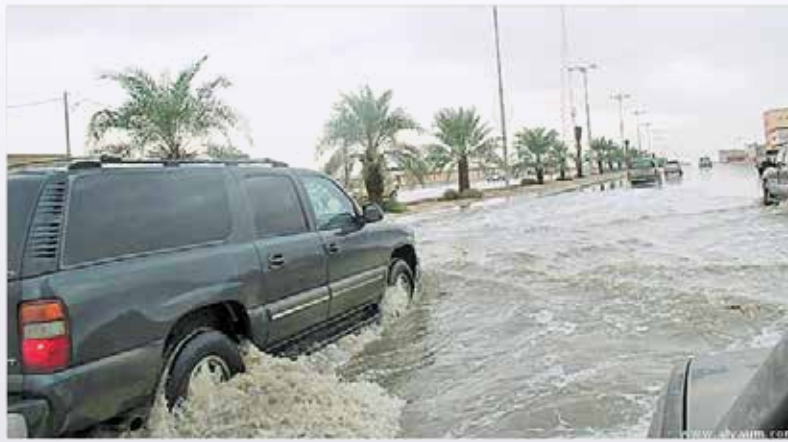
كميات كبيرة من الأمطار ضربت شوارع حفر الباطن