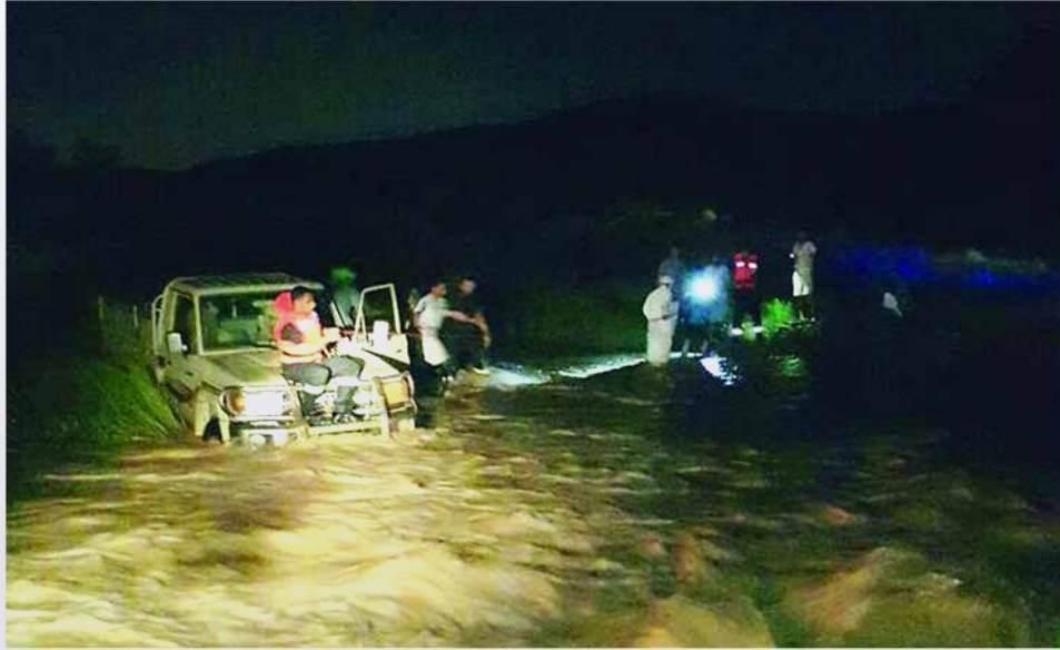
فرق الدفاع المدني تباشر إنقاذ المحتجزين داخل السيارة