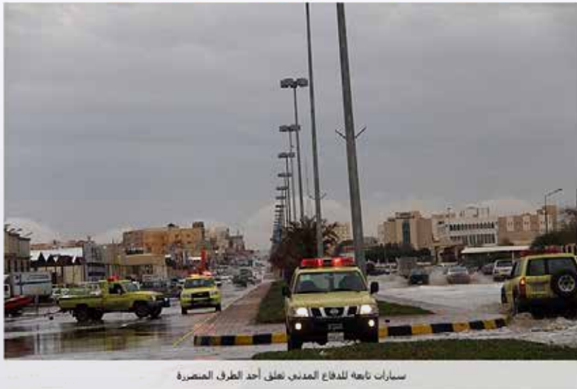
سيارات تابعة للدفاع المدني تطلق أحد الطرق المصصرة

لجنة ثلاثية لحصر أضرار أمطار حفر الباطن.. والبلدية تستنفر طاقاتها