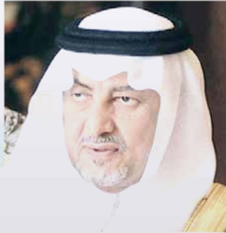
الأمير خالد الفيصل